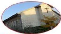
Notre-Dame de la Compassion

► téléphone : 01 48 66 64 72 ► courriel : aulnay.stsulpice@free.fr