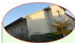
Notre-Dame de la Compassion