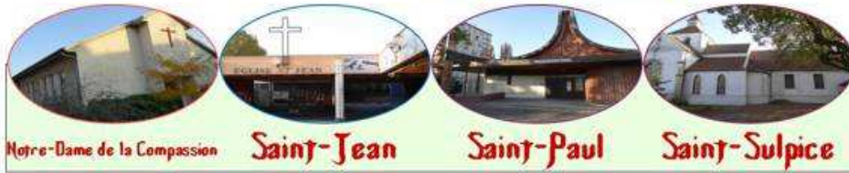
Notre-Dame de la Compassion Saint-Jean Saint-Paul Saint-Sulpice

Paroisse Saint-Sulpice ⇔ place de l'église / parvis Jean-Paul II, 2 rue de Seuran, 93600 Aulnay/Bois ► téléphone : 01 48 66 64 72 / ► courriel : aulnay.stsulpice@free.fr