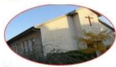
Notre-Dame de la Compassion